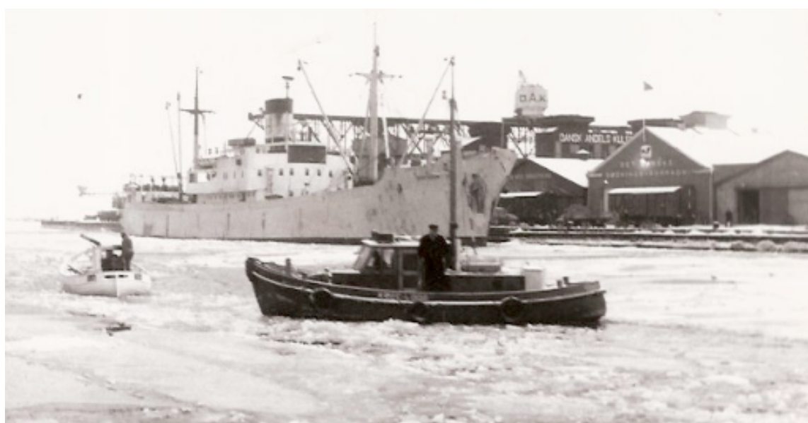
“Køge Lods” bygget i 1947, her i sommer- og vintervejr i Køge Havn.