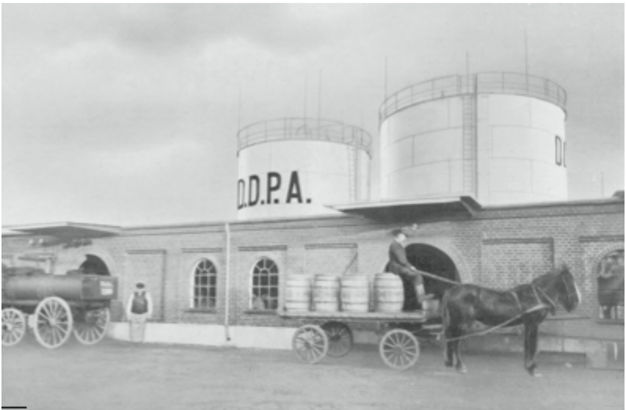
Her ses D.D.P.A.s tankanlæg og tøndelager i Køge med tilhørende hestevogne. Fotos: Rigsarkivet 1930. Bogstaverne står for Det Danske Petroleum-Aktieselskab, der senere blev til Dansk Esso. Fotoet viser, hvordan jernbanesporenes svingradier bestemte industribyggerierne langs havnekajen.